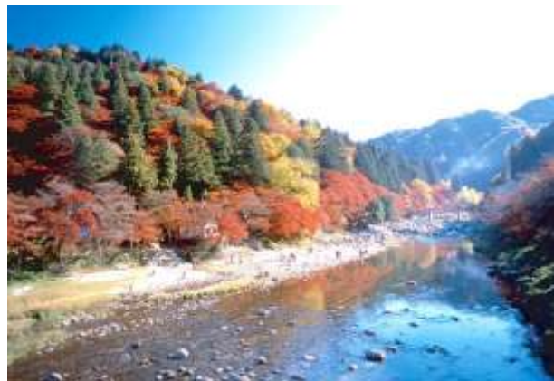
写真1 紅葉の名所として知られる「香嵐渓」

これを受け、行政では、当地区を豊田市景観重点地区に指定(平成22年3月)し、「山並み景観を守る」、「まち並みを活かす」、「足助らしさを育む」の3つの景観形成の方針とした「足助景観計画」を策定している。