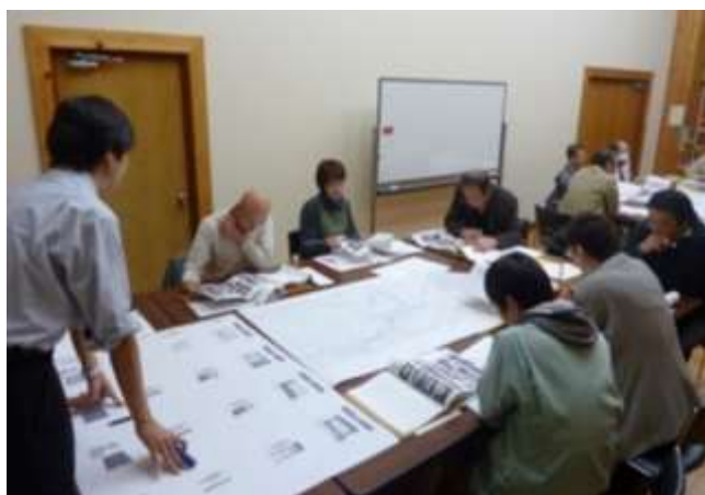
写真4 住民が主体になった「サイン検討委員会」