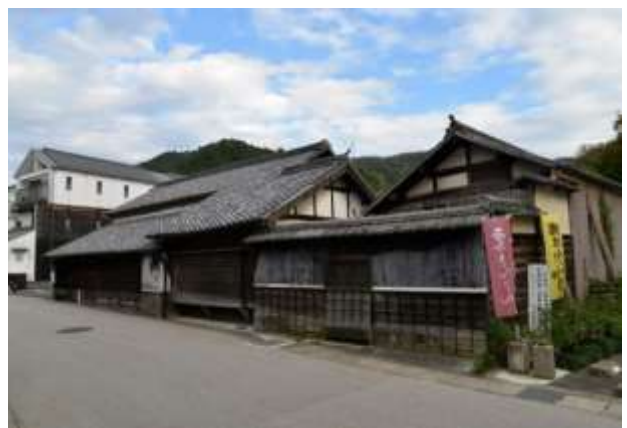
写真5 足助の歴史を伝える建造物(旧紙屋鈴木家住宅)