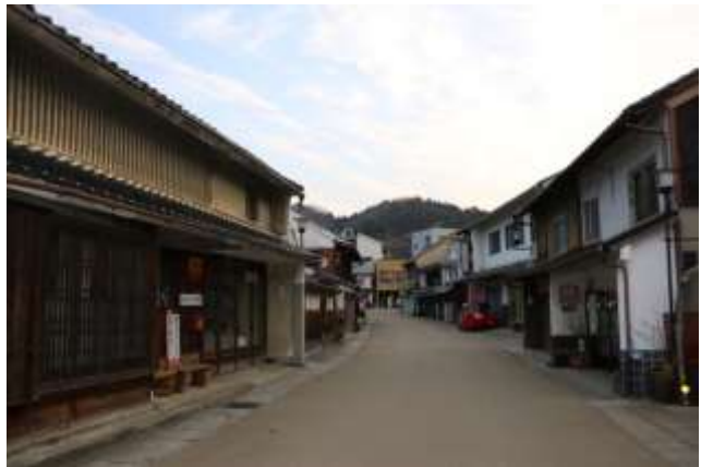
写真3 電柱と白い外側線がなくなったまち並み

当地区は、まち並みを守るため、昭和52年当時、重要伝統的建造物群保存地区の選定に向けた活動を行ってきたが、当時は地区住民の合意が得られず断念している。主な原因としては、保存地区に選定されると、建替え等によるまち並み・景観の現状変更に関わるすべての行為に対し、許可申請が必須となるため、住民の理解が得られなかったものである。冒頭に述べたように、その後の時代の変化もあり、足助まちづくり