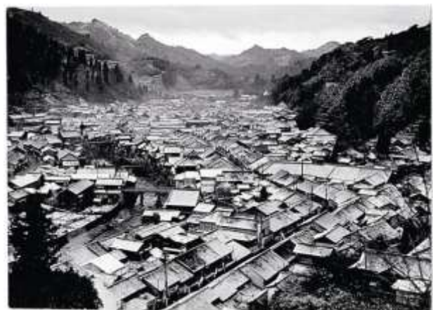
写真2 足助地区の昭和初期のまち並み