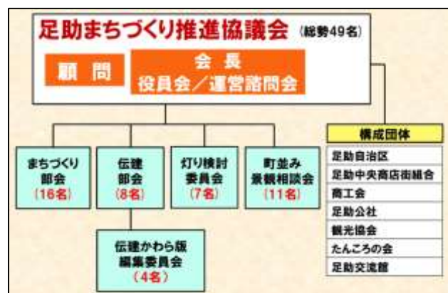
図2 地元の組織体制

事業実施にあたり、市と市民の共働を基本方針として、「足助まちづくり推進協議会」を発足し、ワークショップ開催等による地域住民の意見を反映させたまちづくりを進めてきた(図2)。