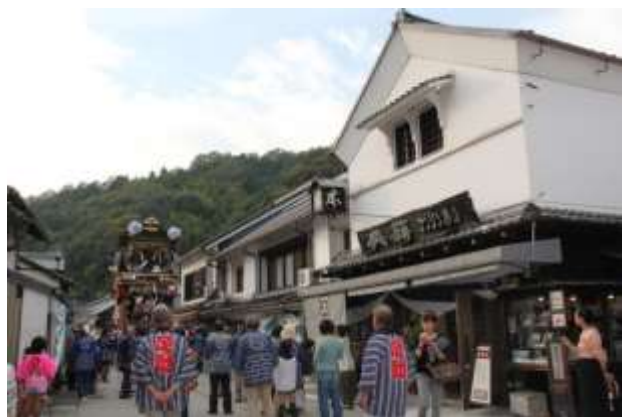
写真6 足助祭りでのにぎわい

当地区における景観整備は終了したが、引き続き、足助まちづくり推進協議会や地域住民、行政が「共働」して地区の様々な問題等を議論し、次のまちづくりに繋げていくことを期待したい。このようなまちづくりが発端となり、地域内で経済を回し、地域の自立と活性化を促進することは、これからの地方創生のロールモデルになり得ると考えている。