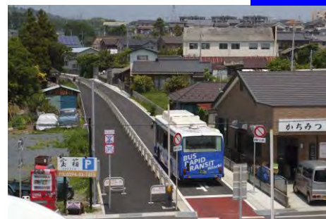
大甕久慈浜連絡道路