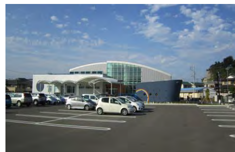
日立市立南部図書館