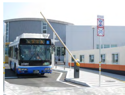
ひたちBRTと交通広場